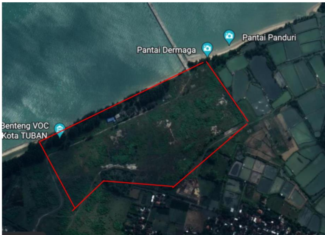
Gambar 2.1 Peta Lokasi Konservasi Pantai Panduri

Pantai Panduri adalah salah satu destinasi wisata yang terletak di Kabupaten Tuban, Jawa Timur. Panduri merupakan singkatan dari pandang berduri karena di pantai tersebut tumbuh subur tanaman pandan dengan akar kuat untuk menahan abrasi akibat gelombang laut. Secara geografis Pantai Panduri terletak pada titik Koordinat 06^{0}46.488'S dan 111^{0}57.345'E dengan luas wilayah 2,5 Ha. Peta rencana lokasi pembuatan Area Konservasi Pantai Panduri, tanda merah di wilayah Desa Tasikharjo dapat dilihat pada Gambar 2.1.1.