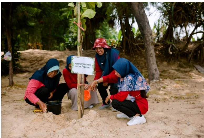
Gambar 3.2 Proses penanaman tanaman buah atau frutikultur dan pemberian pupuk organik abu briket

PT Pertamina Patra Niaga melakukan pengolahan limbah siwalan sebagai pemanfaatan limbah nonb3 menjadi briket. Pada proses pembuatan briket, terdapat sisa abu pembakaran yang tidak digunakan. Timbulan ini perlu diolah agar tidak menumpuk menjadi sampah yang akan mengganggu pertumbuhan tanaman lain dan tidak mengganggu area wisata pantai panduri. Hasil penelitian mengungkapkan bahwa abu kayu dapat memperbaiki sifat kimia tanah dan memberikan tambahan unsur hara yang dibutuhkan oleh tanah.