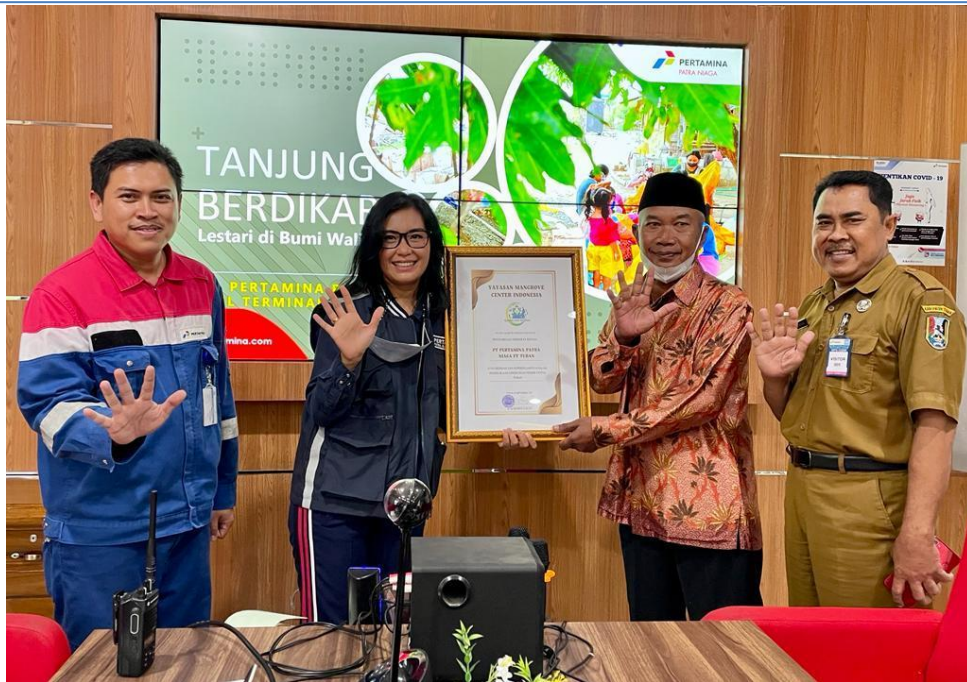
Gambar 3.1 Penghargaan atas program penghijauan pesisir pantai Kabupaten Tuban