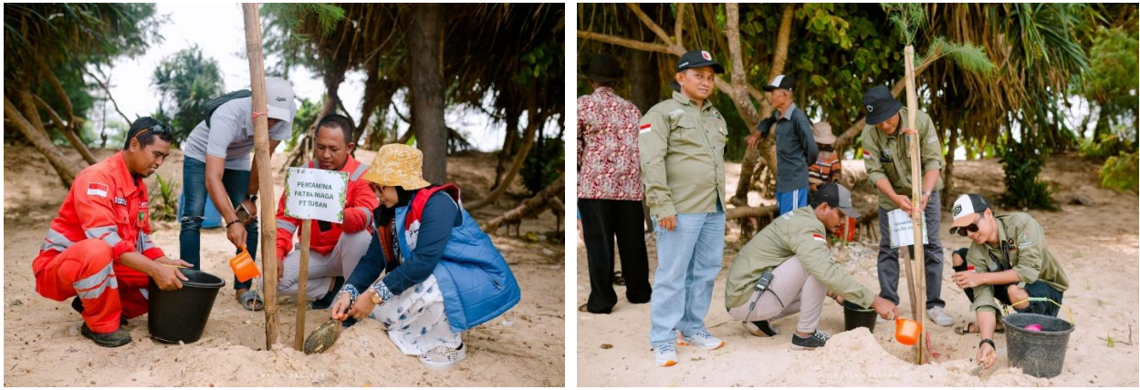
Gambar 3.3 Penanaman tanaman pesisir pantai sebagai upaya pencegahan abrasi